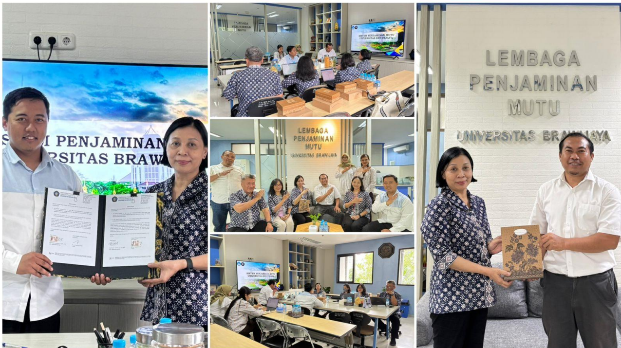
*Sumber foto: Website LPM UB

Lt. 2 Gedung Kampus 1 USD, Mrican, Caturtunggal, Depok, Sleman, Yogyakarta Email: lpmai@usd.ac.id , Telp/VoIP: (0274) 513301, 515352 Ext. 51238